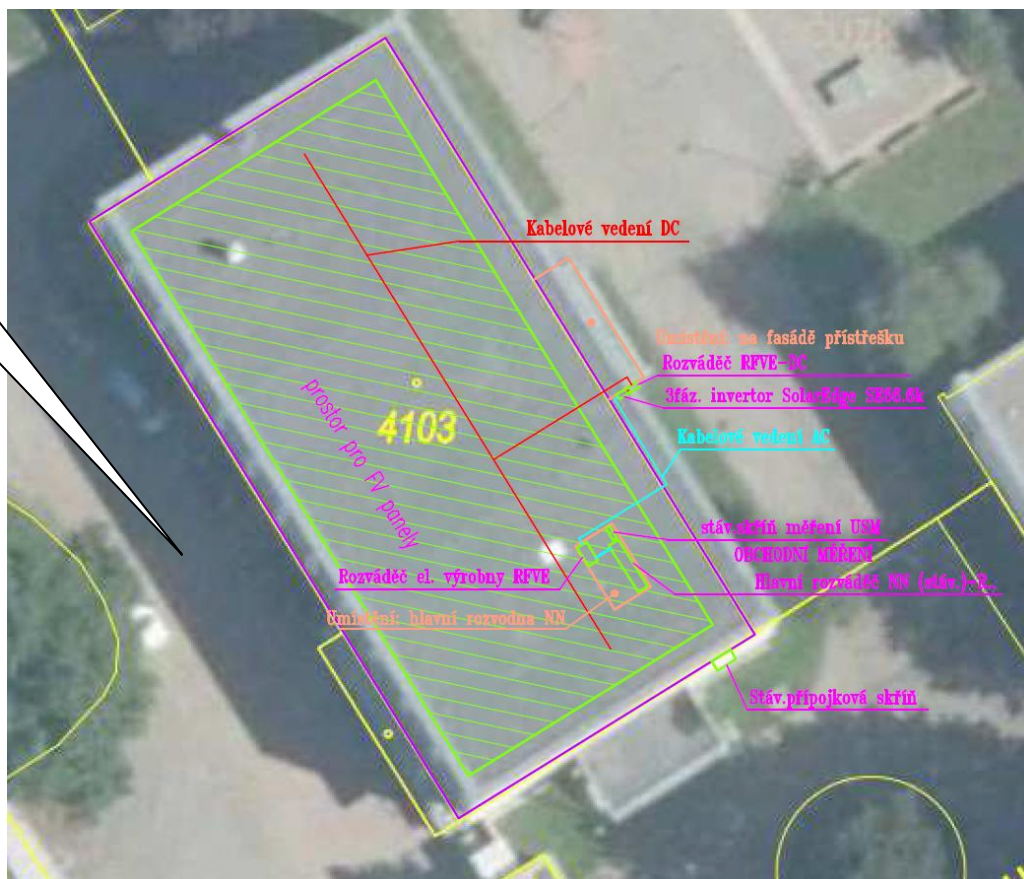
Celkové schéma elektrárny ZŠ U Stadionu.