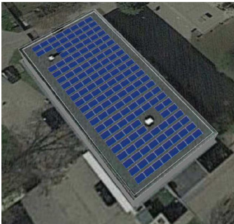
Schéma umístění FV panelů na střechu ZŠ U Stadionu.

Projektová dokumentace řeší stavbu fotovoltaické elektrárny, která se skládá z pole 168 fotovoltaických panelů o jednotlivém výkonu panelu 410 Wp. Umístěno bude na budově jídelny ZŠ. Elektrická energie se bude spotřebovávat a přebytek se dodá do místní distribuční sítě.